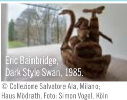
Eric Bainbridge, Dark Style Swan, 1985. © Collezione Salvatore Ala, Milano; Haus Mödrath, Foto: Simon Vogel, Köln

Haus Mödrath, An Burg Mödrath 1, 50171 Kerpen mail@haus-moedrath.de 10 € pro Person (inkl. Eintritt). Kinder und Jugendliche unter 18 Jahren frei