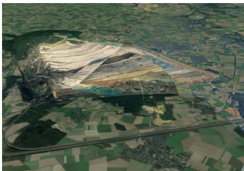
Der Tagebau Hambach heute

„Wenn uns die Umsetzung des Projekts mit den ausgeschriebenen Fördergeldern gelingt, beginnt für die Kohleregion ein neues, zukunftsfähiges Zeitalter“, dessen ist man sich in der Kolpingstadt sicher. Das Thema „Energie“ ist schließlich mit Bergbau und Kohle eines der wichtigsten für die Wirtschaftsentwicklung Nordrhein-Westfalens. Und was läge näher, als daran anzuknüpfen und zwar ohne dabei Ressourcen zu verbrauchen.