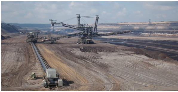
Der Tagebau Hambach heute