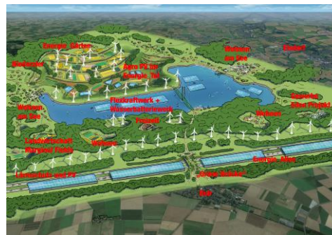
Die EnergieArena 2030