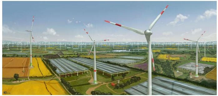
und ab 2030